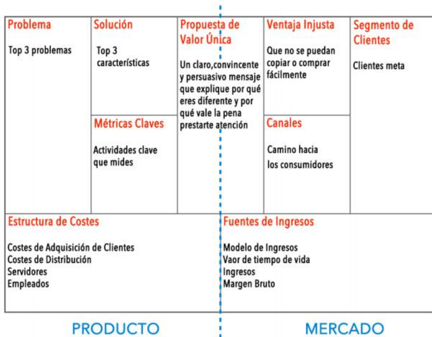
Figura 2: Los nueve bloques del Lean Canvas

9) Ventaja injusta: analizar instrumentos y barreras a construir, para reducir la vulnerabilidad del posicionamiento diferencial que el emprendimiento logre. El emprendedor necesitará experimentar si, realmente, provoca una disrupción en un segmento de mercado, si ésta es sostenible en el tiempo desde la propuesta del negocio y si la respuesta competitiva estará enfocada a vulnerar, igualar o banalizar el posicionamiento a alcanzar por el emprendimientos.