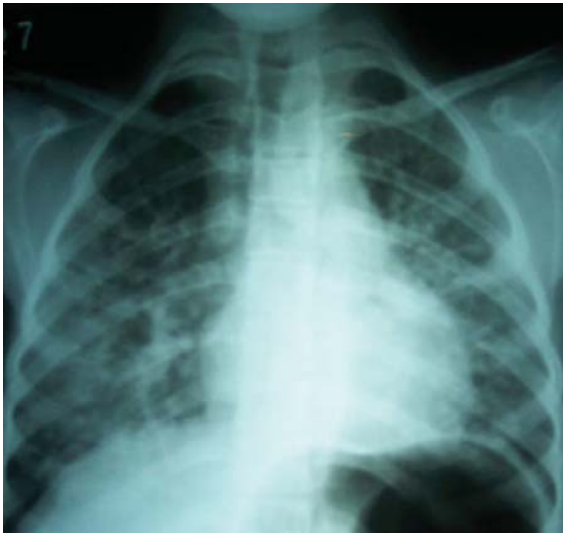
Figura 1. RX de Tórax con infiltrado neumónico en campo basal derecho y trama reforzada en general.

psicomotriz normal. Tiraje supraesternal, roncus, estertores crepitantes bilaterales generalizados y sibilancias, extremidades frías, hipocratismo digital, cianosis peribucal. Sopro sistólico III/VI, ritmo de galope (taquicardia más tercer ruido), frecuencia cardíaca 106 por min. Pulsos positivos, bilaterales y simétricos, piel pálida con turgor y elasticidad disminuida, dermatitis eritematosa descamativa en región periorbitaria y en pliegues de flexión y queratosis palmoplantar, cabello ralo y fino. El resto del examen físico fue normal. (Figura 1)