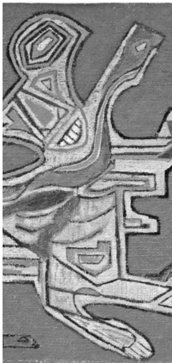
Detalle obra "Habiendo llover", Carlos Oriani