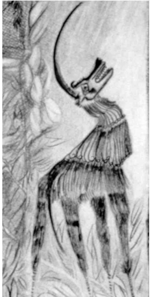
“Repetición 2”, tinta y lápiz Rosario Fernández

A las experiencias positivas se le contraponen las negativas. Es evidente que las experiencias angustiosas que generan los exámenes es la situación más nombrada (28% en los varones y 33% en las mujeres). El examen es el momento en el que se exponen ante un tribunal ocasionándoles a los alumnos una tensión ya que es el momento que define su acreditación según el éxito o fracaso como cierre parcial de un período académico. Además, debemos considerar que siendo las primeras experiencias, éstas se transitan con mayor ansiedad. Por otro lado los alumnos rinden con el objeto de aprobar movidos no sólo en la experiencia individual placentera sino también en función de las expectativas de los padres u otros referentes significativos para estos estudiantes. La tolerancia en estas situaciones varía según los sujetos y sus rasgos propios en virtud de sus procesos singulares de constitución. En las instan-