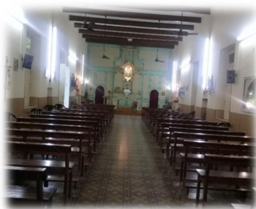
Interior de la capilla que se conserva actualmente en el “Hospital Pediátrico del Niño Jesús”.

Virgen de las Mercedes. Gestionaron la celebración de misas 777 para los días domingos, abonando $2 pesos por cada celebración (1887). 778 Ocupaba el cargo de capellán (1901) el Padre Superior de la Merced, cuya remuneración era de $55 pesos mensuales. 779 El precepto de la misa era obligatorio para todo el personal, así como la buena moral en las costumbres. Sin embargo, la presidenta tenía información que le había transmitido la abadesa de quien “no cumplía con la iglesia [...] y tenía faltas de moralidad”. 780 Posteriormente, se mudaron a otro edificio más amplio (1910), debiendo adaptar un nuevo local para la capilla. En consecuencia, se agregaron algunos elementos donados como un armonium y una casulla morada, la cual había sido concedida por el taller de ornamentos para capillas y templos pobres, y una imagen de la Virgen del Pilar traída de Barcelona, la que fue trasladada al Salón de sesiones. 781 Recién para 1922, se presentó el proyecto de construcción de la capilla oficial, cuya