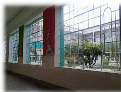
Pasillo que conserva los originales ventanales.

establecimiento, el gasto mensual del Hospicio y las necesidades de esos