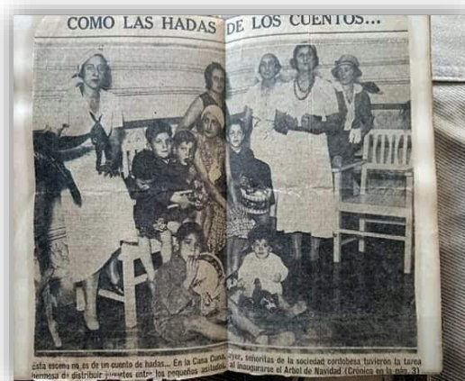
“Entrega de juguetes a los pequeños asilados de la Casa Cuna por señoritas de la sociedad cordobesa al inaugurarse el Árbol de Navidad”S/F.

La dimensión ideológica y cultural del control social que los asistentes ejercieron en los asistidos, se puso de manifiesto también, a través de las conmemoraciones, Memorias, rituales escolares, y el reconocimiento de las benefactoras por su labor, con lo que buscaron dar visibilidad a los alcances del proyecto modernizador vinculado a la infancia asilada. Ejemplo de ello, fue el significado otorgado a la fecha del 12 de Octubre en que se conmemoraba el nacimiento de la Casa Cuna. Anualmente, el aniversario comenzaba con la bendición del sacerdote y el oficio de una misa en homenaje a la Virgen del Pilar, patrona de la Casa Cuna y protectora de la SDP y de los