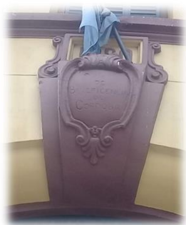
Inscripción en la parte superior del ingreso al antiguo “Hospital de Niños de la Santísima Trinidad”, que destaca la presencia de la “Sociedad de Beneficencia de Córdoba” (1880).

La importancia que adquirió la participación social de la mujer en la acción caritativa tuvo múltiples alcances: ya sea como vehículo de las diferentes estrategias de dominación, integración y control social de la elite sobre la población sin recursos; o como eficientes administradoras de los recursos públicos y privados de las instituciones que regenteaban; también como intermediarias entre otras mujeres que pertenecían a sectores sociales bajos; y sobre todo fueron sensibles a la problemática de la niñez desvalida. Así, la matrona cordobesa adquiriría visibilidad en el entorno público y se