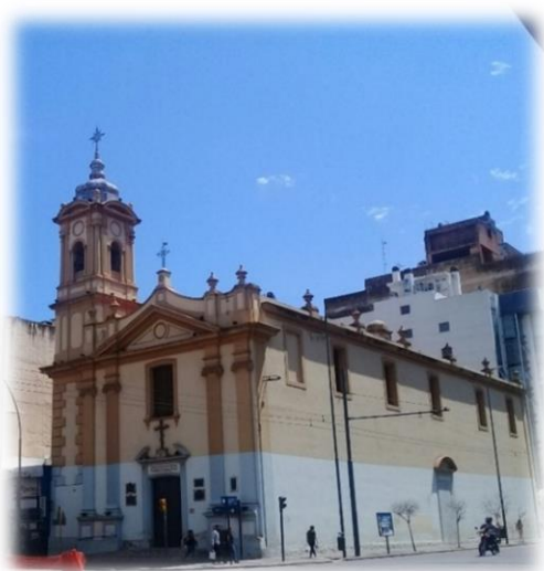
La Iglesia Nuestra Señora del Pilar (1738-1875). Monumento Histórico Nacional Reconstruida, en la que se destaca a la imagen Zaragozana de la “Pilarica”.

El significado del Bautismo: este rito estuvo vinculado a la alta mortalidad infantil. Desde la fe cristiana, fue entendido como un acto de salvación del alma del pequeño que se encontraba en riesgo de muerte, así como una preservación de la vida espiritual del niño, convirtiéndose en un puente hacia la eternidad. Los niños expósitos de la Casa Cuna recibieron este sacramento en múltiples templos de la iglesia católica de la ciudad de Córdoba, como la Parroquia de Nuestra Señora del Pilar, la Catedral, la Parroquia del Rosario, la de San Vicente, la de las Mercedarias, así también en Hospitales como el San Roque, Misericordia, Clínicas, o en instituciones como el Buen Pastor, y en la misma Casa Cuna, pero también se encuentran mencionados en el Registro de bautismos, otros lugares donde los niños recibieron las aguas bautismales,