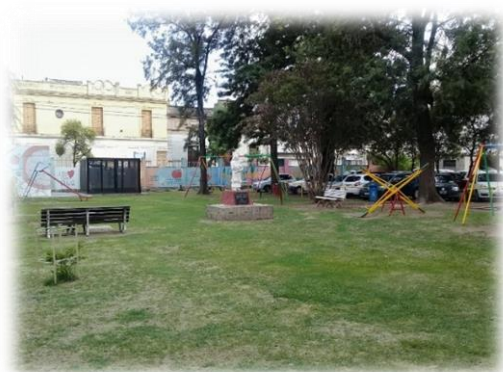
Parque “Mil sonrisas para los niños” ubicado en uno de los patios del establecimiento.

Quizás donde más se refleja la infancia de los expósitos, es a través de aquellas experiencias de esparcimiento y de recreación propias de su edad que vivenciaron en el