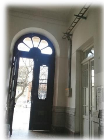
Vista desde el interior del ingreso principal del establecimiento.

-Luego encontramos a los niños que ingresaban en calidad de pensionados 412 , por ellos, se abonaba un pago para cubrir los gastos de su estadía en la institución, que era realizado tanto por bienhechores, familiares y mujeres que conocían la situación de pobreza de las madres, o eran sus empleadoras. 413 Ejemplifican esta categoría, el caso