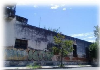
Lugar donde funcionó la Casa Cuna entre 1885 y 1909 sobre las calles Oncativo y Salta.

En cuanto a la venta de la propiedad de la calle Salta y Oncativo, se presentaron