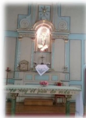
Altar de la capilla.

La capilla y la celebración de misas: funcionaba en el establecimiento, un espacio habilitado y autorizado por el obispo, para oratorio, al que concurrían las damas bajo la dirección espiritual de un sacerdote. 773 En 1885, la Casa Cuna se trasladó a otro edificio 774 , y hubo que acondicionar el sitio destinado a la capilla. La escasez de recursos para obtener los elementos correspondientes, impulsó a las socias a recolectar pedacitos de oro y plata para la construcción del Cáliz 775 , además recibieron diversas donaciones, como manteles de hilo 776 , y una imagen de la