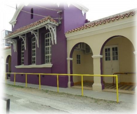
Aquí funcionaron antiguamente los lavaderos, en la actualidad opera el servicio de rehabilitación del “Hospital Pediátrico del Niño Jesús”.

En 1921, se abrió la parte del ingreso del establecimiento, ubicado sobre el Boulevard Castro Barros, que contaba con una sala de sesiones, un archivo, un toilette, el consultorio externo, una sala para los médicos, “y otra pieza con las instalaciones necesarias de salubridad”. 261 Asistieron al acto inaugural, diferentes autoridades (gobernador, vice, ministros) y demás funcionarios, quienes junto a las damas y personalidades de la alta sociedad alentaron y