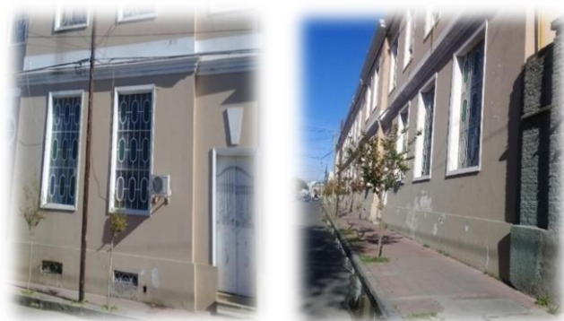
Sobre la calle Francisco Soler, en la parte lateral del edificio nuevo de la exCasa Cuna fue ubicado el torno.

a) La modalidad que más engrosaba la admisión de los niños en la Casa Cuna era la que se efectuaba a través del torno . Se trataba de un artefacto con forma de cilindro ahuecado que giraba sobre su eje comunicando el interior, ya sea un establecimiento de beneficencia o un convento, con el exterior, es decir con la calle. A través de una campanita se hacía saber que se