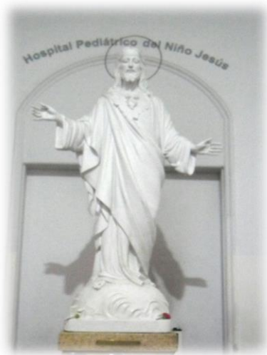
Imagen ubicada en el ingreso del establecimiento.

misas, sacramentos (bautismos, comuniones y confirmaciones), y la difusión de la doctrina cristiana, lo que respondía a los valores religiosos de las “Damas de la Providencia”. La presencia de las congregaciones religiosas, el capellán y los misioneros en cotidianidad de los niños asilados, facilitaba la acción cristiana en la Casa Cuna. En ese sentido, expresaba la presidenta diciendo que: