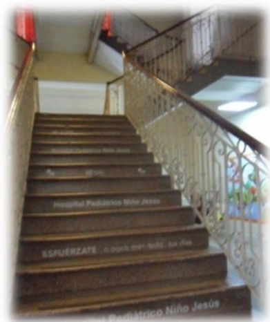
Escaleras hacia la planta alta del establecimiento.

otros adelantos, como ocurrió con la instalación de luz eléctrica (1902), entendiéndose que