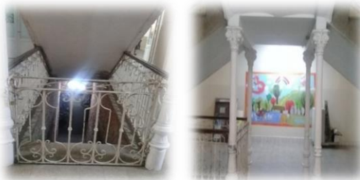
Sótano del establecimiento.

Este recorrido muestra el arduo trabajo realizado por las damas a lo largo del tiempo, no sólo en lo que a la atención de los niños se refiere, sino en las gestiones que las diferentes Comisiones Directivas pudieron llevar a cabo, procurando incorporar al establecimiento