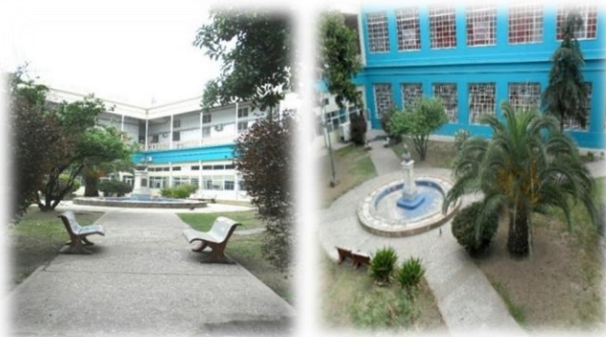
Vista de uno de los patios internos del “Hospital Pediátrico del Niño Jesús. Fuente propia”.

b) Higiene: las indicaciones sobre los cuidados diarios incluían, el ingreso de luz y aire al interior del recinto 664 para ventilar los salones de los niños, y recomendaban al personal sacar a los pequeños al patio en un horario