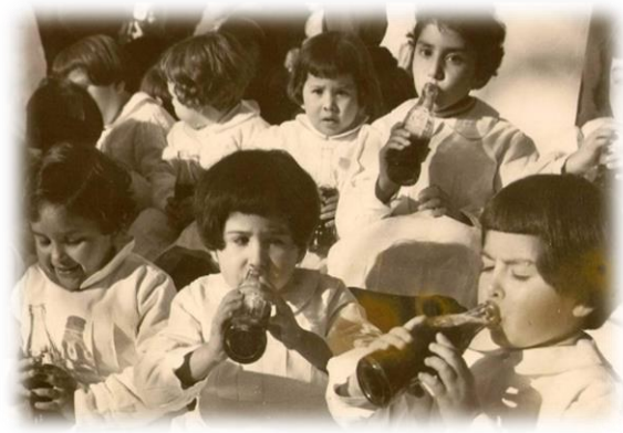
“Niñas expósitas de la Casa Cuna bebiendo una gaseosa”(1959).

El creciente interés en la historiografía social por las dimensiones subjetivas vinculadas con el denominado retorno a la agencia humana, han permitido poner foco, en aquellos sujetos que fueron parte de las instituciones asistenciales, es decir, los asistentes y los asistidos. Experiencias como la Casa Cuna de Córdoba, permiten