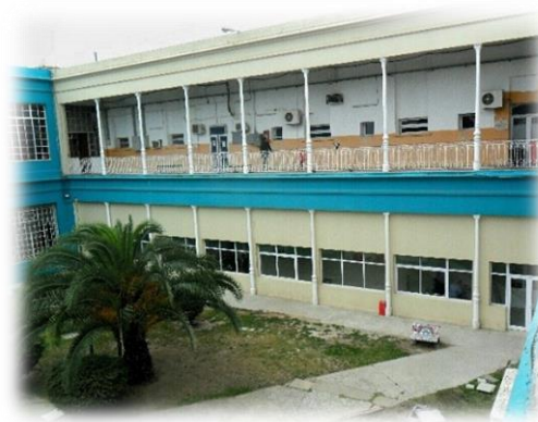
Imagen de las dos plantas del establecimiento ex Casa Cuna.

El establecimiento estaba destinado para alojamiento y crianza de criaturas de ambos sexos de la primera infancia, es decir, niños recién nacidos hasta los 3 años de edad. Los cuidados se enfocaron principalmente en cuestiones de sanidad, alimentación, vestimenta, y a medida que iban creciendo, también se incluyó la educación primaria e instrucción en Artes y Oficios. No menos importante fue el desempeño de aquellos niños expósitos ya mayores, que llevaron a cabo diversas faenas domésticas y la confección de productos que reportaron beneficios económicos a la institución.