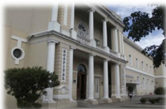
Fachada de la ex Casa Cuna sobre Boulevard Castro Barros.