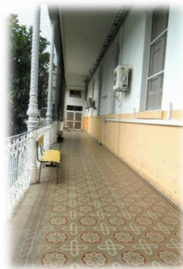
Galería en la planta alta del establecimiento.

Sin duda, estos caminos signados por las damas tuvieron resultados. En ocasiones, la colaboración provino de la población caritativa, en otras, el aporte lo realizaron los sectores dirigentes, con quienes las socias compartían vínculos de clase. No menos importante, fueron los lazos de solidaridad que ellas lograron con otras sociedades de beneficencia. 372 A esto habría que agregar los fondos propios que la Sociedad generaba para que la Casa Cuna “se sostubiese con altura y dignidad en las