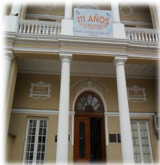
En la parte superior del ingreso principal de la ex Casa Cuna se observan las inscripciones “Charitas Christi” y “Amor al huérfano”, testimonios de la imponente labor social desde su fundación.