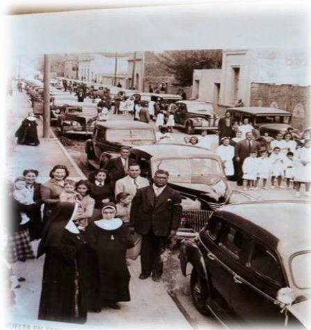
“La vuelta en taxi para los desamparados” S/F. En la imagen se observa a las religiosas acompañando a los niños de la Casa Cuna.

También los paseos a diversos lugares de la ciudad y fuera de ésta, proporcionaron momentos de esparcimiento. Las visitas al zoológico, le aportaban a los niños instrucción y