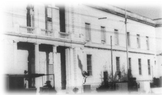
Nuevo edificio de la Casa Cuna en el Pueblo San Martín S/F.

La obra de edificación de la Casa Cuna finalizó en 1912, cuya distribución de espacios incluía dos plantas, un subsuelo, y en algunos lugares, un entrepiso. En 1917, la visita de miembros del Ministerio de Obras Públicas, entre otras autoridades, destacaban la labor de la SDP a quienes atribuían la habilidad, pese a los escasos recursos, de: