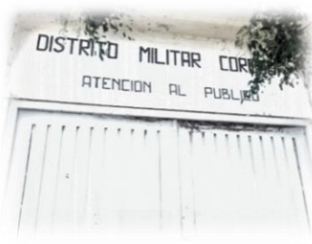
Ex Distrito Militar Córdoba ubicado entre las calles Oncativo y Salta.

En cuanto a la venta de la propiedad de la calle Salta y Oncativo, se presentaron