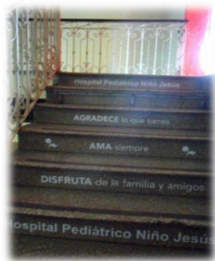
“Agradece lo que tienes. Ama siempre. Disfruta de la familia y amigos”. Hospital Pediátrico del Niño Jesús.

En síntesis, con la creación de organismos estatales como el consultorio “Protector de la Infancia” y la “Gota de Leche”, el protoestado social municipal fue ocupando mayor terreno en la asistencia social infantil, introduciéndose en espacios institucionales donde el espíritu de la caridad cristiana tenía fuerza en las mujeres que se ocupaban de una significativa porción de la infancia vulnerable presente en el ejido urbano. 1037 El compromiso empeñado conjugó los esfuerzos entre sus asistentes, cuyos vínculos -no exentos de conflictos- impactaron en cambios profundos en el tratamiento de la niñez a nivel social e institucional, erradicando prácticas que interrumpían el desarrollo saludable del niño, y propiciaron la apertura de nuevas estrategias para la protección de la vida de las criaturas. La acción social de las “Damas de la Providencia” estuvo a travesada por todas estas transformaciones, conservando de igual modo, su autonomía en el control de la Casa Cuna que se prolongó por largo tiempo. Estas mujeres, fueron constructoras de las bases de las tempranas políticas sociales de la infancia en la ciudad de Córdoba. Proceso que fue protagonizado