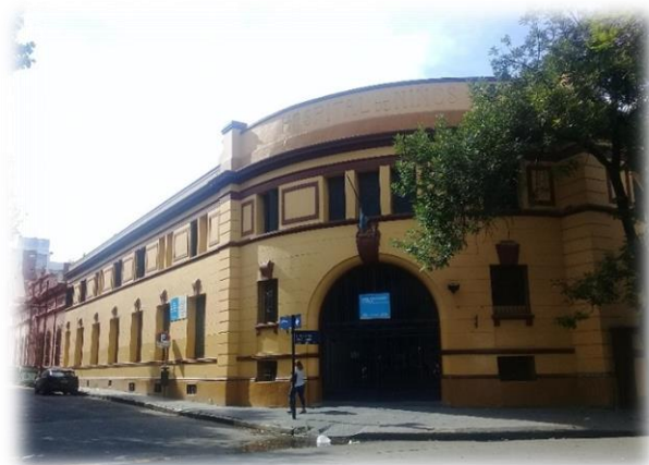
Antiguo edificio del “Hospital de Niños de la Santísima Trinidad” bajo la administración de la Sociedad de la Beneficencia de Córdoba, ubicado entre las calles Entre Ríos, Balcarce, Corrientes y T. Cáceres de Allende.