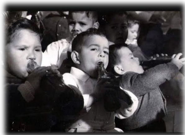
“Niños expósitos de la Casa Cuna bebiendo una gaseosa”(1959).

siglo XIX hasta las primeras décadas del siglo XX, los constituye en una vía directa para acercarnos al estudio de los niños expósitos del pasado.