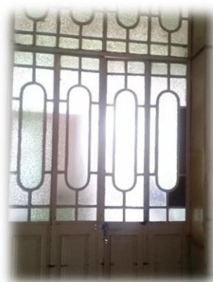
Puerta mampara que aún conserva su original estilo para facilitar el ingreso de luz.

a) Prevención: cuando ingresaba un niño al establecimiento, se constataba si padecía alguna enfermedad contagiosa, y si se comprobaba que estaba enfermo, se lo aislaba en otra habitación. En caso de hallarse sano, se lo devolvía, para prevenir el contagio en épocas de epidemia, o se lo ubicaba bajo el cuidado de personas que se hallaban fuera del establecimiento. La abadesa ponía en conocimiento del médico las condiciones que presentaban los expósitos y éste indicaba el procedimiento a seguir. 662 Para 1921, se aplicó la vacunación y revacunación de los niños y del personal como medida preventiva por “la peste reinante de la viruela”. 663