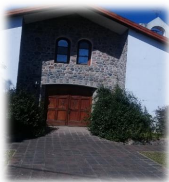
Capilla del Hogar Bethel, ex Escuela “Presidente Justo”. Ascochinga, Córdoba.