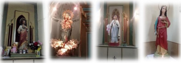
Imágenes religiosas exhibidas en la capilla, de izquierda a derecha: Sagrado Corazón de Jesús, María Auxiliadora, Virgen de la Merced y Santa Lucía.

Ceremonias religiosas: representaron la afinidad que tenían las “Damas de la Providencia” con el sector de la iglesia católica. En efecto, se expuso en la capilla el Santísimo Sacramento, inaugurando (1917) el Manifiesto, los primeros viernes de cada mes “trayendo el hermoso acto un gran beneficio espiritual y moral a la Casa”. 807 Otra ceremonia de notable relevancia, se produjo en la conmemoración del trigésimo quinto aniversario de la fundación del establecimiento, en la que se celebró por primera vez, la