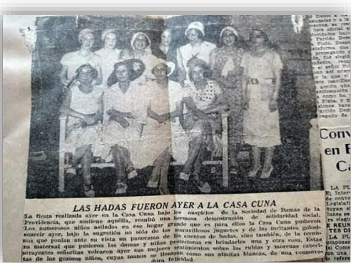
“Visita de las hadas a la Casa Cuna, parte de un festejo que la Sociedad “Damas de la Providencia” hacía para los niños expósitos” S/F.

un arduo trabajo en las socias. 866 Para ello, acordaban la fecha del evento en relación a otro de carácter público, que podía ser por ejemplo, la inauguración de algún