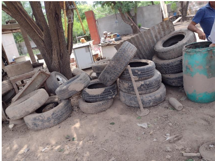
Fotografía 10 Neumáticos utilizado como combustible

Un hecho curioso de la familia A, unos días antes de la visita, una gran cantidad de animales se encontraban con gripe, habían notado en un número importante de animales de