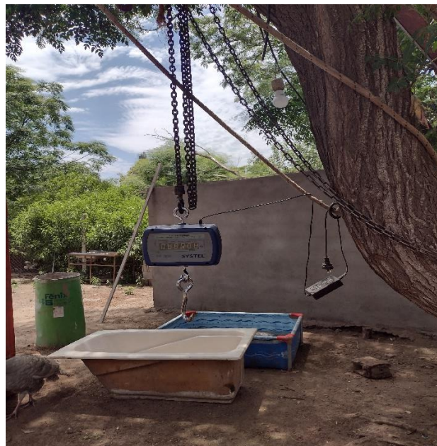
Fotografía 8 Adelante una balanza para pesar el animal, atrás, piletones para lavar el animal