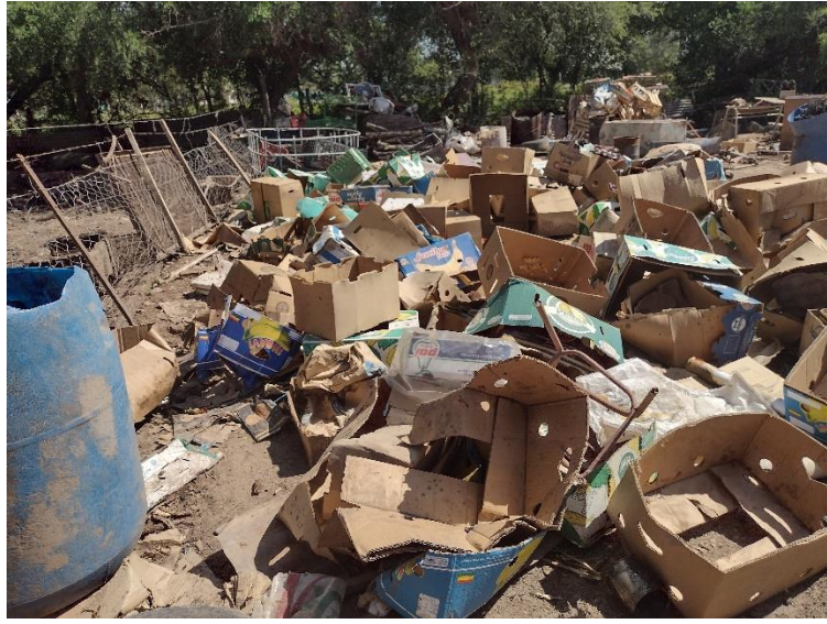
Fotografía 9 Basurero destinado para alimento y combustible