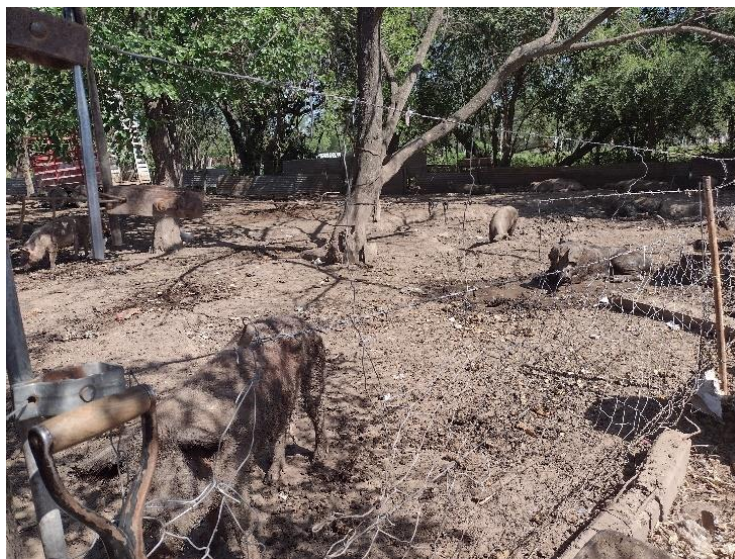
Fotografía 6 Chiquero

Las metodologías de sacrificio son absolutamente precarias, el animal padece sufrimiento, un estrés pos mortem que luego es necesario una maduración excesiva, que se realiza a la intemperie, debajo de un árbol, los animales son quemados donde el combustible es generado por quema de basura y neumáticos.