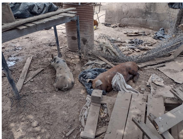
Fotografía 12 Animales, tejidos, maderas, plásticos