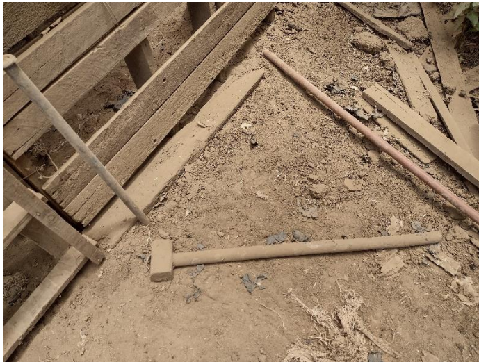
Fotografía 7 Maza para matar el animal