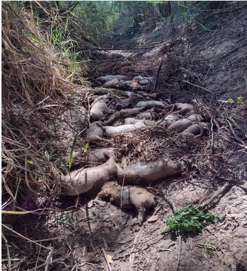
Fotografía 11 Cementerio de animales

Dentro de su desesperación y no saber que acciones realizar ante la cantidad de animales muertos, los desecharon en un canal a cielo abierto en un campo vecino, a tan solo 2 km de donde ellos viven.