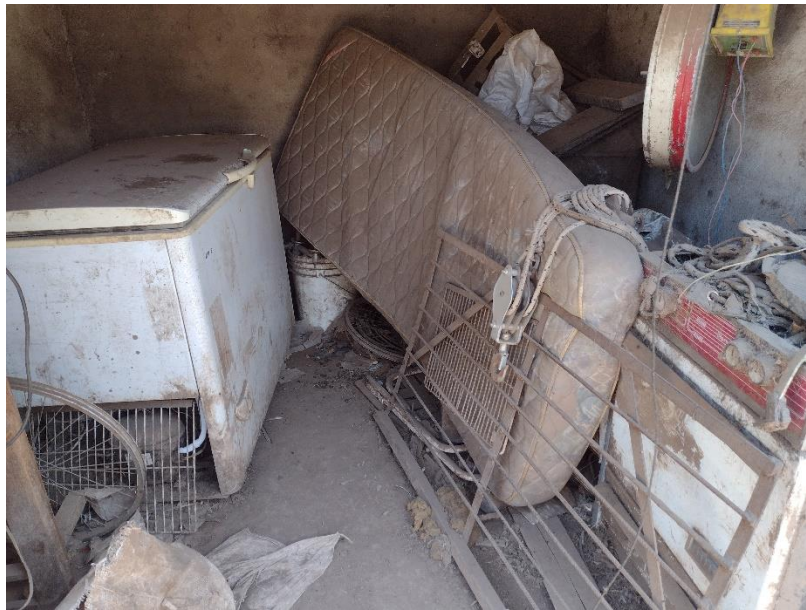
Fotografía 14 Equipo para refrigerar lechones