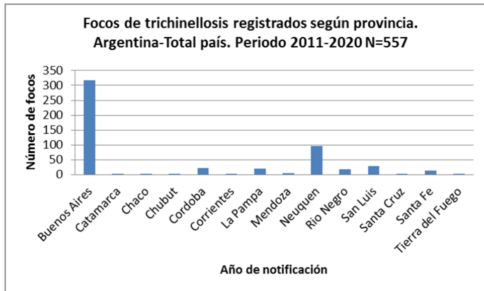
Gráfico 2 Focos de trichinellosis confirmados por provincia de notificación. Argentina. Periodo 2011-2020. N=557 Fuente: elaboración propia – SENASA

El año que presentó mayor cantidad de focos confirmados fue el año 2020 con un total de 80 y el año con menor cantidad de confirmaciones fue el 2011 con un total de 25 focos