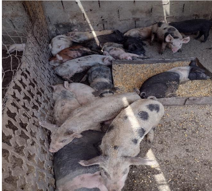
Fotografía 5 Cerdos seleccionados para el sacrificio

putrefacción, conviven con sus propios desechos, grandes catidas de moscas, incluso en la piel y ojos, presencia de materia fecal propia del animal, fuerte holores de orina, excrementos de roedores en los alimentos.