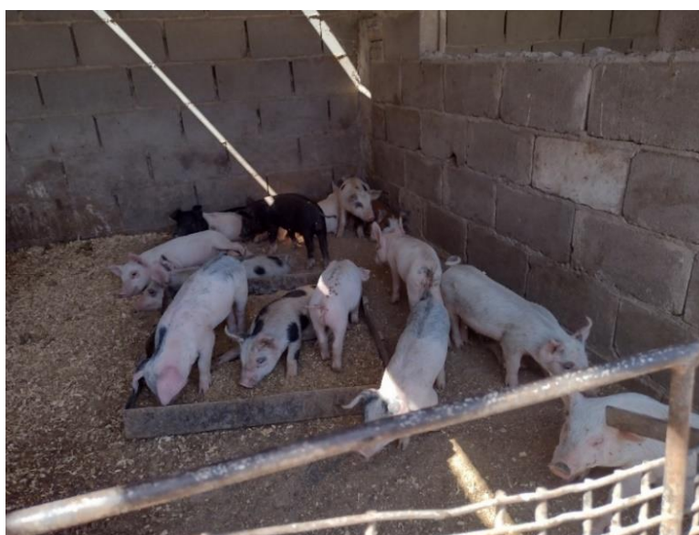
Fotografía 1 Cerdos mal alimentados, muy delgados

Familia A, constituía por Pancho de aproximadamente 65 años, analfabeto, firma con su dedo pulgar o lo hace su hija de aproximadamente 28 años, con estudios primarios, Don Pancho vive con su esposa actual Nana, con quien tiene tres hijos de 8 años, 6 años y 2 años, todos viven hacinados, con falta de higiene personal, su condición económica es muy baja, cuentan con una camioneta muy vieja utilizada como utilitario para transportar los animales, vivos y muertos, los alimentos de éstos, y de uso común, como por ejemplo, para el traslado de los niños a la escuela y, en el mismo lugar donde viven, tienen los cerdos que se muestran a continuación en condiciones alarmantes de salud e inseguridad alimentaria.