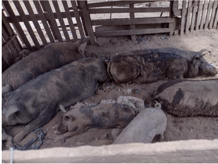
Fotografía 13 Cerdos mal nutridos, sin agua, entre basura