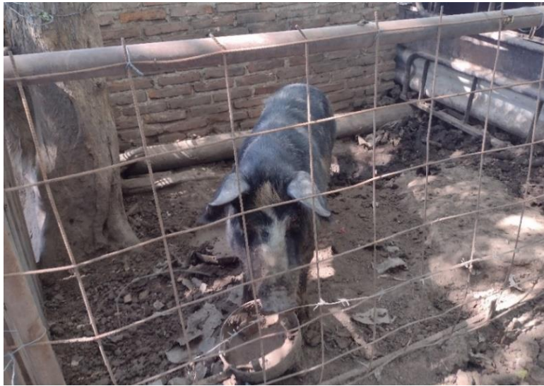
Fotografía 2 Cerdo aislado, sin agua y alimentado con basura.