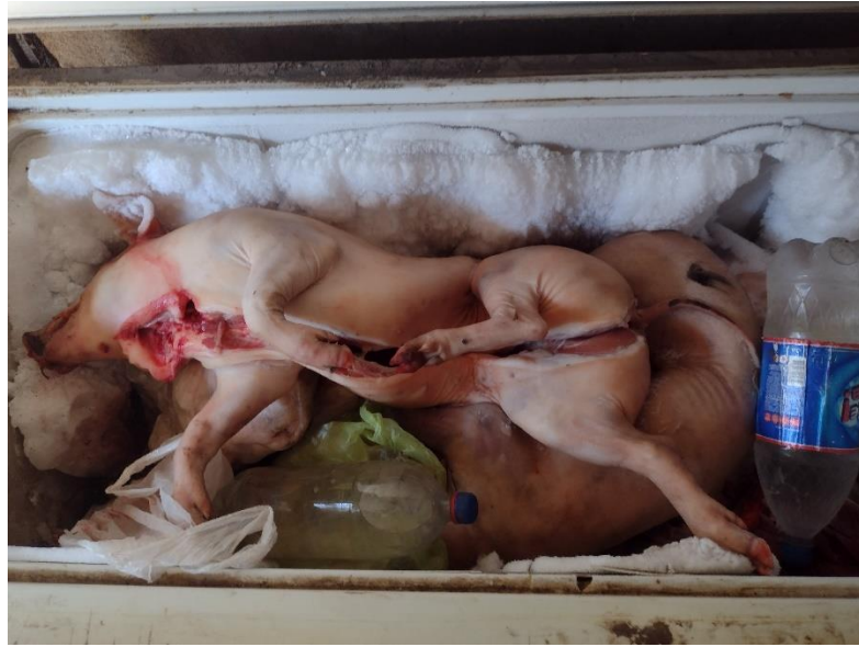
Fotografía 15 Lechones refrigerados con otros productos

La relación de la vulnerabilidad con la pobreza, radica en que mientras la primera pone énfasis en el impacto provocado por el cambio en la modalidad de desarrollo sobre los recursos de las personas y familias, la pobreza da cuenta de la escasez de ingresos para cubrir las necesidades básicas de los hogares. Desde luego, vulnerabilidad y pobreza tienen naturales puntos de encuentro, puesto que el conjunto de recursos que tienen los individuos y las familias, son los que pueden generar mayores o menores ingresos dependiendo del marco de oportunidades y las posibilidades de insertarse en ellas. (Gutiérrez, 2002)