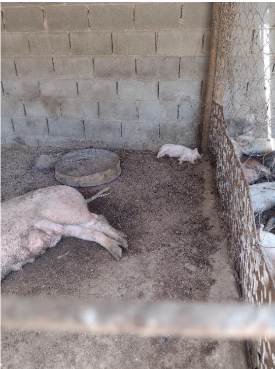
Fotografía 4 Hembra con un crío muerto