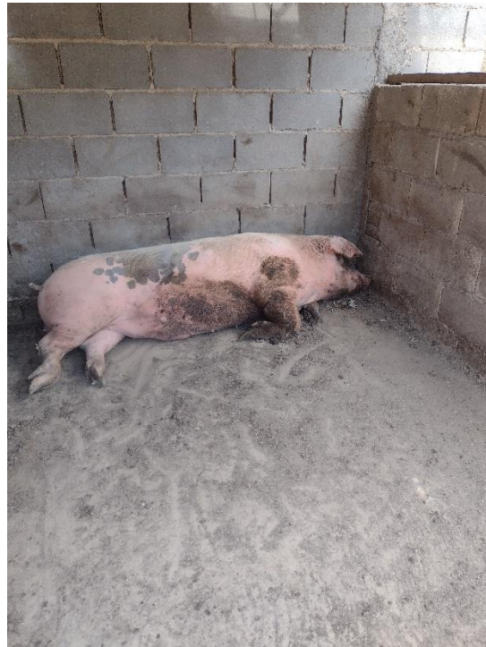
Fotografía 3 Hembra en agonía

Se muestran animales mal alimentados, expuestos a altas temperaturas, sin disponibilidad de agua, sin higiene en el habitáculo, con existencia de roedores por presencia de excrementos, estos animales al igual que los otros se alimentan de basura, frutas y verduras casi en estado de